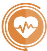
KARDIOLOGIA I KARDIOCHIRURGIA