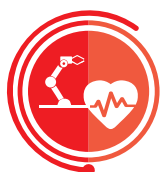
URZĄDZENIA WSPOMAGANIA SERCA I WSZCZEPIALNE PROTEZY SERCA