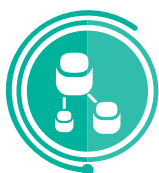
SYSTEMY INFORMATYCZNEGO WSPOMAGANIA ZABIEGÓW OPERACYJNYCH