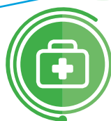
BIOMATERIAŁY I MATERIAŁY MEDYCZNE