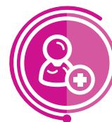
SPERSONALIZOWANE WYROBY MEDYCZNE