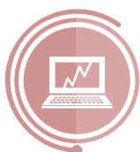
PRZETWARZANIE I ANALIZA DANYCH, SYGNAŁÓW I OBRAZÓW BIOMEDYCZNYCH